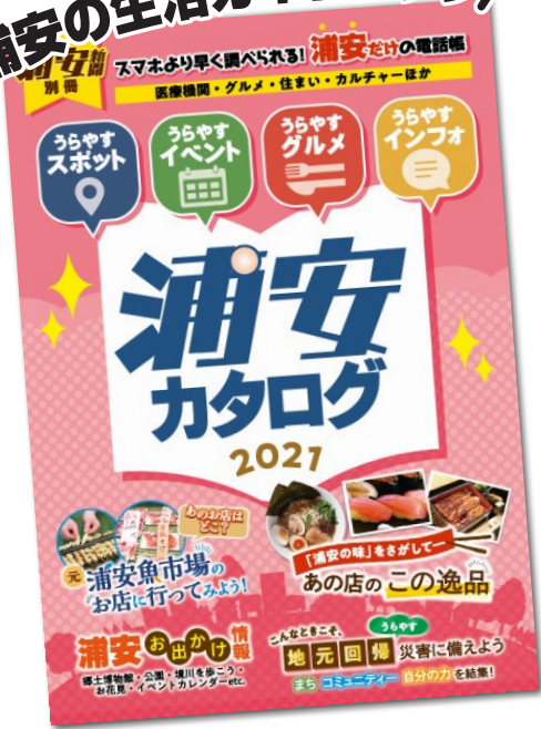
▲昨年発行の浦安カタログ